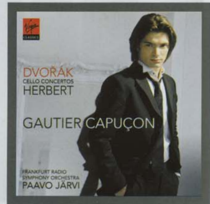
GAUCIER CAPUÇON DVORAK